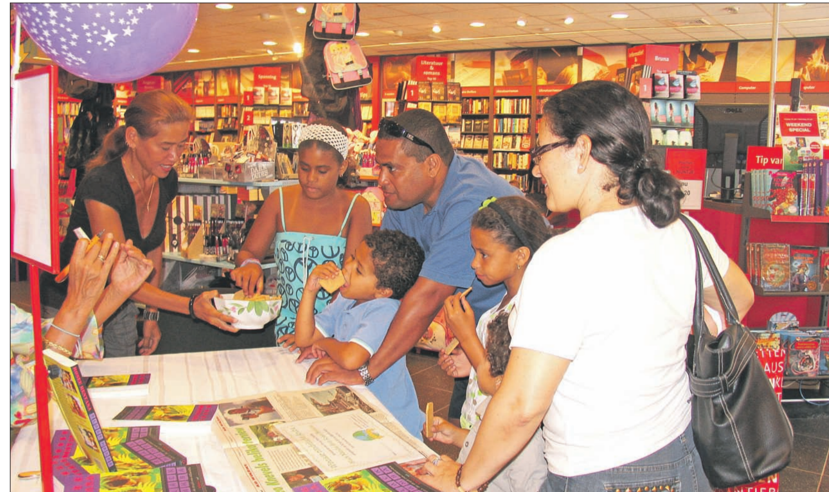
Signeursessie van Black Mamba op Aruba.

tasie en realiteit, waarbij zaken van alledag zoals school en vrije tijd, het genieten van het jong zijn maar ook het willen zorgen voor de ouderen in de samenleving moeiteloos overgaan in gefantaseerde gebeurtenissen in onderaardse grotten en gangen. Hiermee wordt een bruggetje gebouwd tussen de eigen tijd en de geschiedenis van het eiland, want een groot deel van het verhaal speelt in een best wel geheimzinnig landhuis. Black Mamba - waarnaar het boek genoemd werd - is namelijk de oudste plantage op het eiland. Dat leidt tot realistische reminiscenties aan de tijd van de slavernij en fantastische herinneringen aan het verzonken Atlantis, maar brengt het verhaal ook in