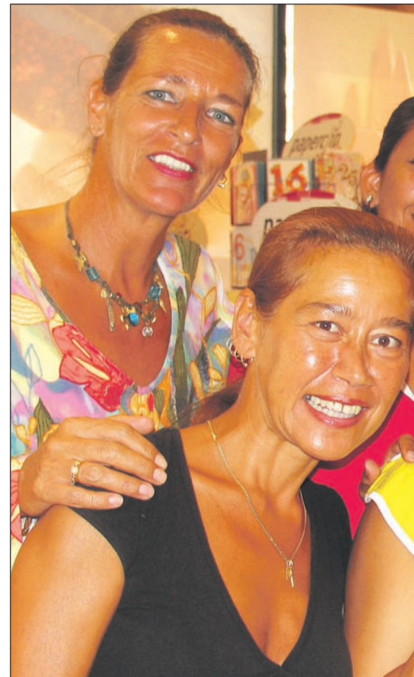
De twee schrijfsters van Black Mamba die onder pseudoniem geschreven hebben.

Een volgende brug is die tussen wat traditioneel jongens- en meisjesboeken genoemd werden. In dit verhaal is er sprake van niet minder dan zes hoofdpersonen: Nikita (15 jaar), Claire (16 jaar) en Kirza en de drie jongens van gelijke leeftijd Roy, Francis en Alvin. Samen zullen ze op avontuur uitgaan en ze zijn daarbij aan elkaar gewaagd. Het zijn vooral de meisjes die hun mannetje staan om zo te zeggen. Er komen ook ouders en anderen in het verhaal voor, al dan niet heel kritisch beschreven. Dan is er een brug tussen fan-